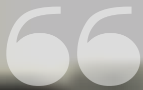
IMMAGINE CURATA NEI DETTAGLI